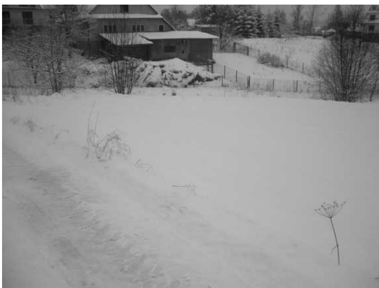
Obszar nr 8