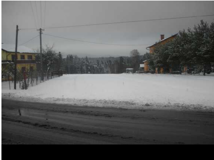
Obszar nr 9