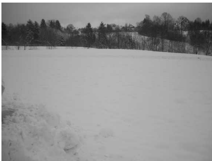
Obszar nr 6