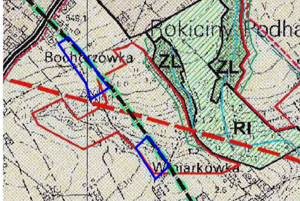
Wyrys ze studium uwarunkowań i kierunków zagospodarowania przestrzennego gminy Raba Wyżna