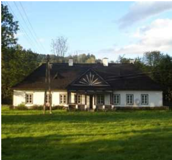
Fot. 6. Dwór w Sieniawie