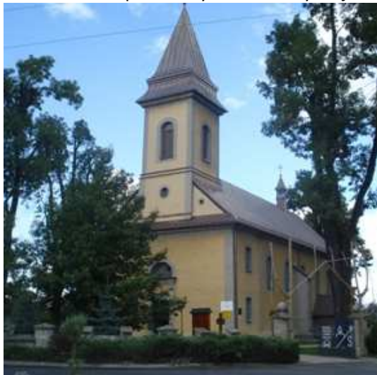
Fot. 1. Kościół parafialny w Rabie Wyżnej