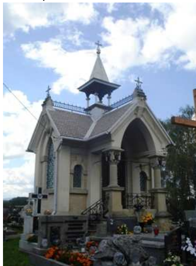
Fot. 4. Kaplica cmentarna w Rabie Wyżnej