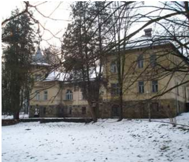
Fot. 2. Dwór w Rabie Wyżnej