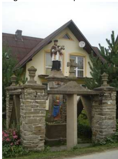
Fot. 8. Figura św. Jana Nepomucena w Podsarniu