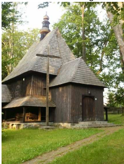
Fot. 7. Kościół św. A. Padewskiego w Sieniawie

Kamienna figura św. Jana Nepomucena w Podsarniu pochodząca z pocz. XIX w. figuruje w rejestrze zabytków jako zabytek ruchomy.