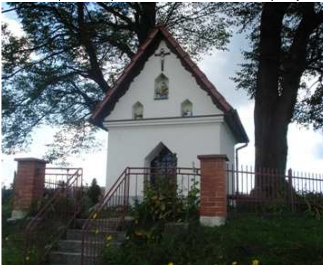
Fot. 3. Kaplica III upadku P. Jezusa w Rabie Wyżnej

W Rabie Wyżnej do rejestru wpisane są również dwie kaplice: kaplica cmentarna rodziny Zduniów i Bzowskich z 2 poł. XIX w., położona na cmentarzu parafialnym oraz kaplica III-go upadku Pana Jezusa z końca XIX w.