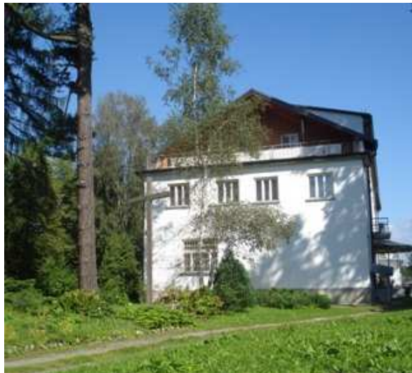
Fot. 5. Dwór w Rokicinach Podhalańskich